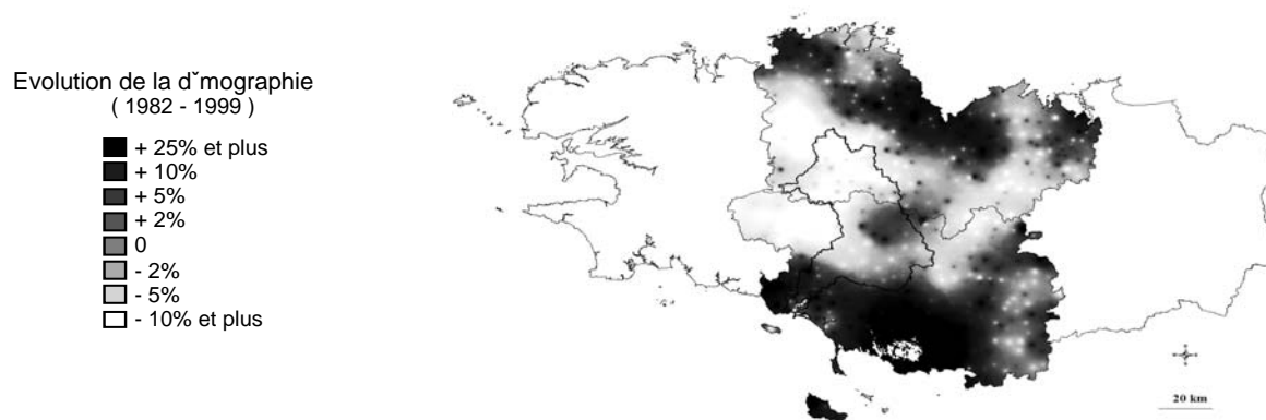
Figure 2. La formalisation d'évolutions passées à long terme et à grande échelle permet l'extrapolation de tendances futures : l'exemple de la démographie.

Le mode de construction du scénario tendanciel est donc essentiellement l'extrapolation des mécanismes de régulation du territoire en place actuellement. Par exemple, on maintient l'hypothèse que l'usage des sols sera en grande partie déterminé par l'évolution de l'agriculture sur des critères de performance économique et que les actions réglementaires s'inscrivent dans ce cadre. Dans cette optique, les perspectives macro-économiques des grandes filières (lait, volailles, porcs, cultures) sont comparées et des hypothèses à long terme sont proposées (recul des volailles, concentration des exploitations laitières et porcines...). De même, les tendances démographiques et socioprofessionnelles sont prolongées en conservant les mêmes critères d'attractivité du territoire. Des cartes d'évolutions régionales resituant le Blavet dans un cadre plus large sont alors particulièrement mobilisées. La figure 2 illustre cette approche pour la démographie.