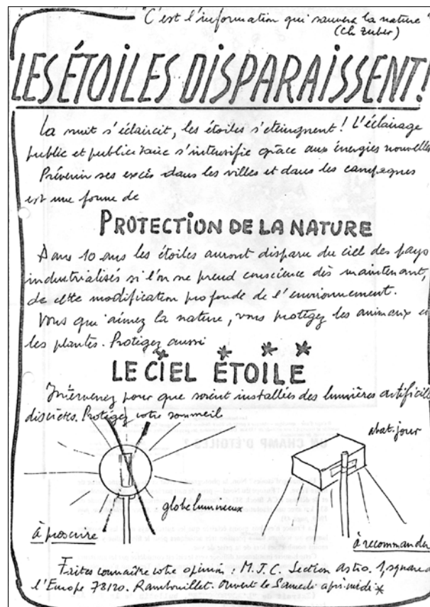
Image 3. Mécanismes de montée et de descente en généralité, « mise en valeur » autoréférentielle de la nature et de tout un patrimoine. Tracte de la « Section Astro » de la MJC de Rambouillet.

Le mécanisme de montée en généralité est ainsi le premier allié des astronomes amateurs, qui leur permet de sortir leur argumentaire d'une défense d'intérêts sectoriels souvent très locaux. Ainsi, les aspects communs à l'Humanité des avantages tirés de la vision du ciel nocturne étoilé ont très vite été utilisés : il ne s'agissait plus de « sauver notre ciel », mais bien de « rendre le ciel nocturne à l'Humanité ». Plus encore, et à la suite de la saisie par les écologues de la thématique, rattacher aux effets de la lumière sur la visibilité du ciel nocturne les effets et impacts écologiques et environnementaux a permis aux astronomes de consolider cet argumentaire global et d'y adosser l'idée de l'intérêt supérieur de la sauvegarde du nocturne (image 3).